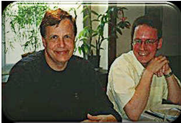
Près de Colmar