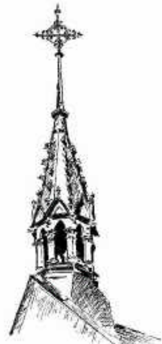
Clocheton de l'EEM de Colmar