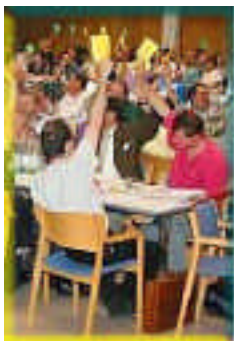
Vote pendant une séance plénière

Puis vint la discussion du rapport des surintendants, dense, concis et précis sur l'évolution souhaitée et souhaitable de l'Église - qui mérite d'être repris, étudié et discuté dans chacune de nos Églises locales. C'est un outil pour aider à toute évaluation comme à toute évolution. Le document est accessible sur Internet ( http://www.umc-europe/agen/documents/rapportDV2002.pdf ).