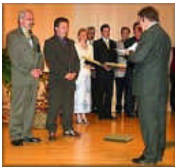
Le culte d'ordination