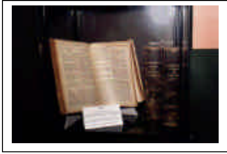
Une vue de l'Expo-Bible 2001

Nous avons reçu les encouragements de nombreux chrétiens comme ce groupe comportant deux pasteurs, dont l'un a écrit : « Je souhaite que le Saint-Esprit amène beaucoup de personnes dans cette Église à la rencontre du message d'amour de Dieu, la Bible, sa Parole, pour y trouver la vie en lui. » Un encouragement, mais aussi un défi pour notre communauté !